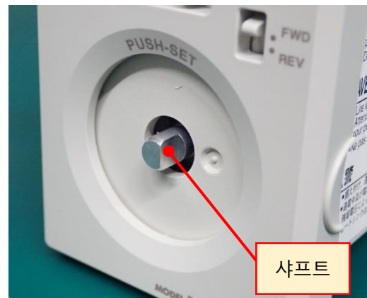
【다이얼을 분리한 상태】